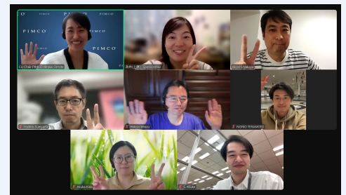
オンライン会議風景

A. 全体会議、サブコミッティがそれぞれ毎月1度の会議を行っています。イベント開催日が迫るにしたがって必要に応じて開催しています。各サブコミッティではお仕事の状況に応じてチームでお互いにサポートしながら業務を分担しており、概ね週に1時間程度が目安になります。