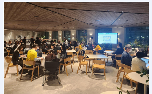
実行委員会の様子

A. 毎年約5,000人が参加するFITチャリティ・ランを企画・運営しています。FIT実行委員メンバーは様々な金融機関や関連事業を展開する企業から集まった50名強のボランティアから構成されています。