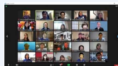
オンライン会議風景

A. 全体会議、サブコミッティがそれぞれ毎月1度のオンライン会議を行っています。イベント開催日が迫るにしたがって必要に応じて開催しています。各サブコミッティではお仕事の状況に応じてサポートしあいながら業務を分担しており、概ね週に1時間程度が目安になります。