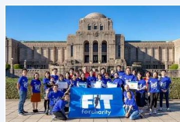
2021年実行委員会メンバー（一部）

A. 毎年5,000-6,000人が参加するFITチャリティ・ランを企画・運営しています。FIT実行委員会メンバーは様々な金融機関や関連事業を展開する企業から集まった約50名のボランティアから構成されています。